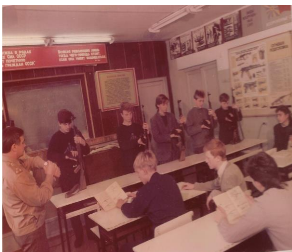
Рис.13 Соревнования по НВП

Большое внимание на проведение военизированных игр, в которых принимали участие солдаты из близлежащих воинских частей, что для юношей было и полезно, и интересно. Это были годы спокойствия и уверенности в завтрашнем дне.