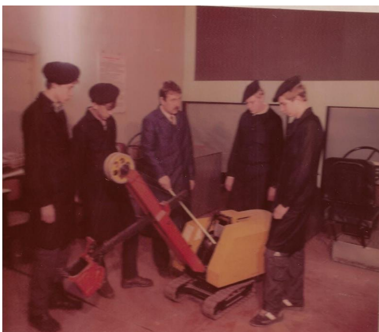
Рис.7 Отработка навыков на автотренажере