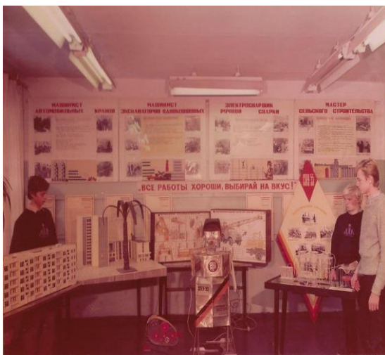
Рис.9 Выставка технического творчества

В училище было широко развернуто соревнование. Победители награждались туристическими поездками по нашей стране или в страны социалистического содружества.