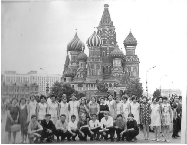
Рис.10 Поездка в Москву. Группа №17 июль 1977 г.

В педагогическом коллективе тогда было много мужчин, и это положительно сказывалось на воспитании, так как в большинстве учащихся были юноши, осваивающие профессии каменщика, сварщика.