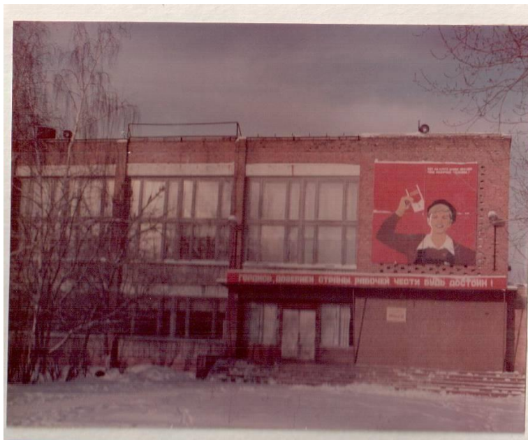
Рис.1 Центральный вход

В далеком 1967 году на базе ордена Ленина строительного- монтажного треста №25 основано профессионально- техническое училище № 55, в котором тогда готовили: