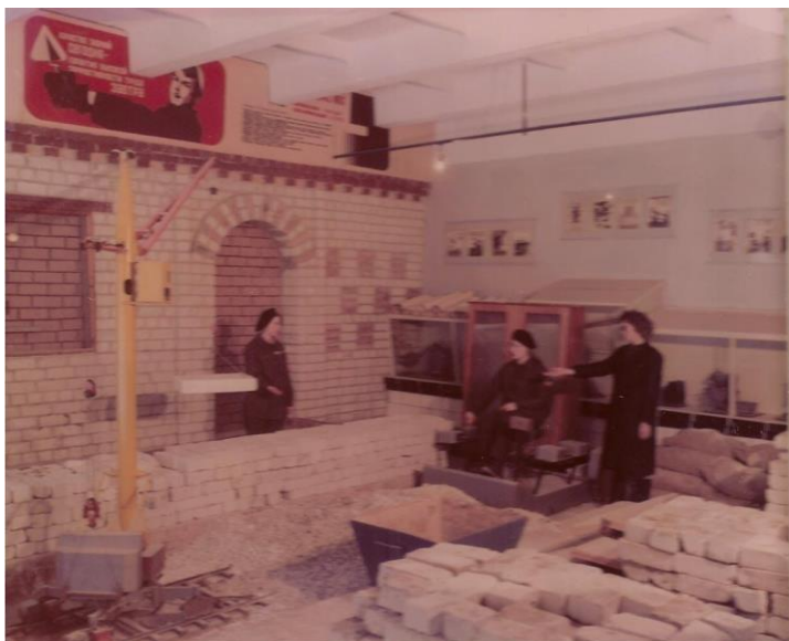
Рис.6 Тренажерные занятия машинистов башенного крана

высокоморальных молодых людей. И многое им удавалось. Кабинеты в училище были оснащены гораздо лучше, чем в школах. Здесь все было автоматизировано, прекрасно оформлено, было достаточно наглядных пособий, предусмотренных программой.