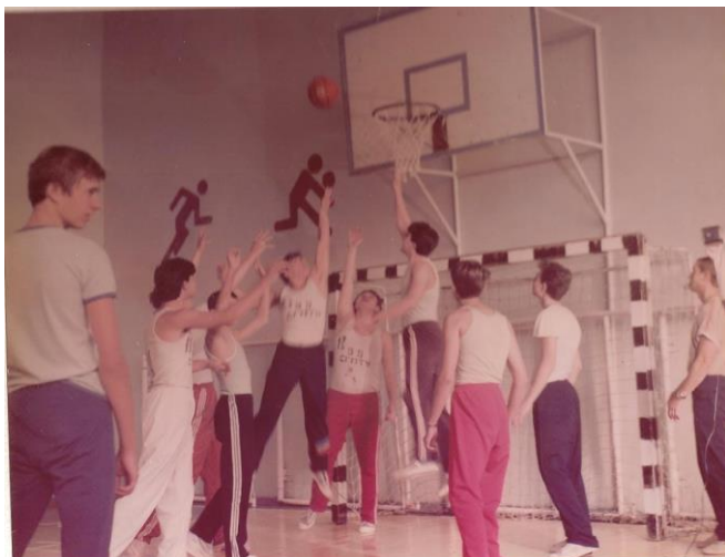
Рис.14 Соревнования по баскетболу

Вся спортивно- массовая работа в училище проходит под девизом: «Стартуют все!». В течении учебного года в училище проводилась спартакиада. Особенно массово и празднично проходили традиционные спортивные праздники, которые проводились два раза в год: сентябрьский праздник «Золотая осень» и весенний спортивный праздник, посвященный дню победы.