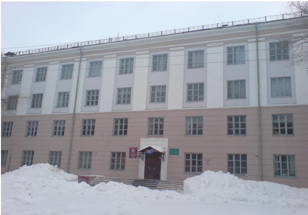
Рис.1 Корпус ННХТ, ул. Миронова 5

Контингент учащихся вечерних филиалов в г. Новокуйбышевске общей численностью 874 человека, из них вечерних отделений 681 чел. и заочных 193 человек.