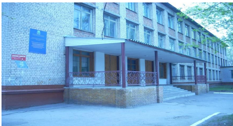
Рис.11 ННХТ, ул. Кирова д.4

Постановлением правительства Самарской области от 02.07 2012г. ГБОУ СПО НТТК реорганизован в ГБОУ СПО ННХТ Располагается по адресу: г. НСК, ул. Кирова д.4